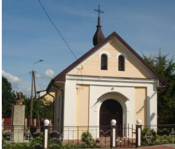
Zdjęcie 6. Kapliczka przy ul. Czarnieckiego