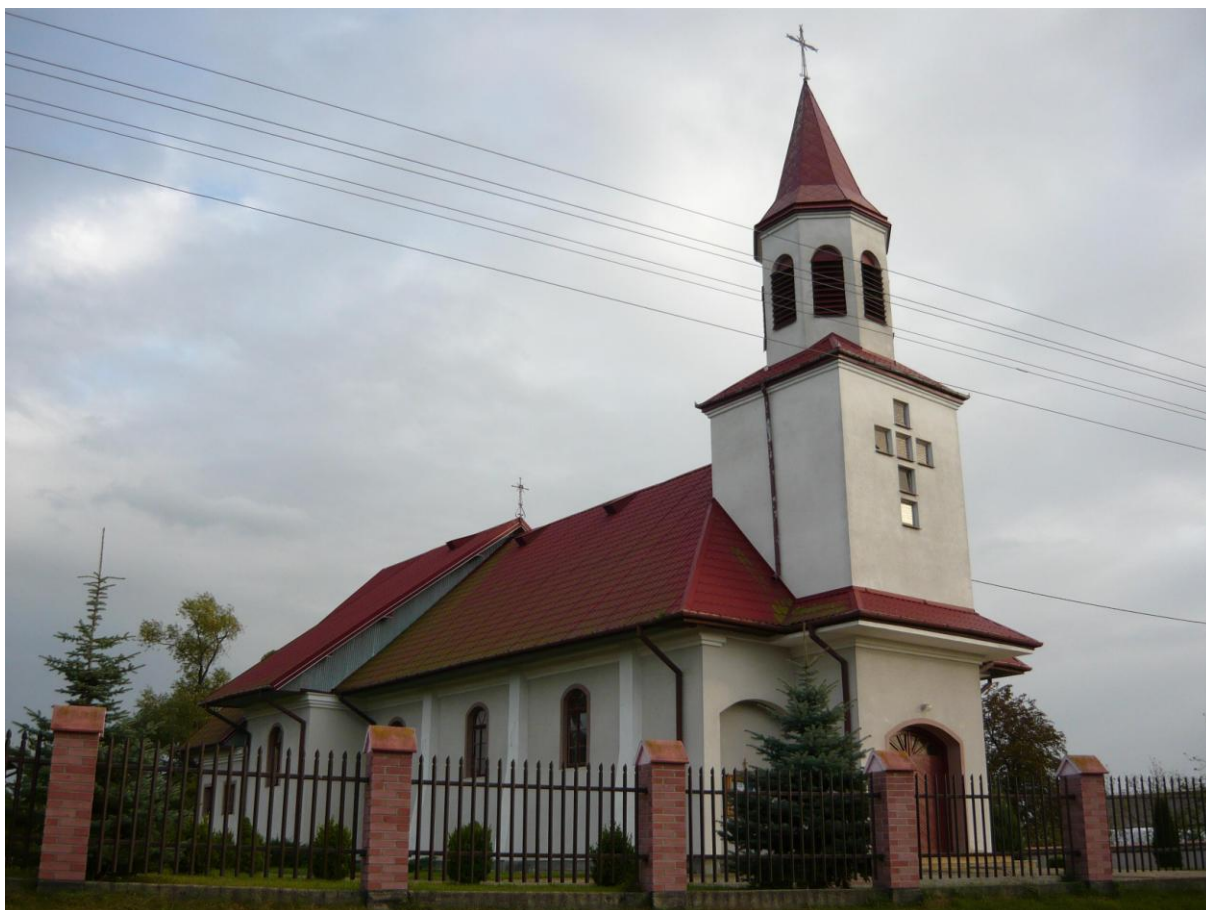
Zdjęcie 2. Kościół parafialny w Bronowie