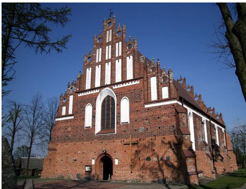
Zdjęcie 2. Kościół parafialny p.w. św. Jana Chrzciciela w Wiznie