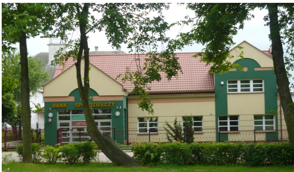
Zdjęcie 12. Bank Spółdzielczy

W centrum Wizny usytuowany jest Urząd Pocztowy oraz oddział Banku Spółdzielczego w Piątnicy, obsługujące mieszkańców całej gminy.