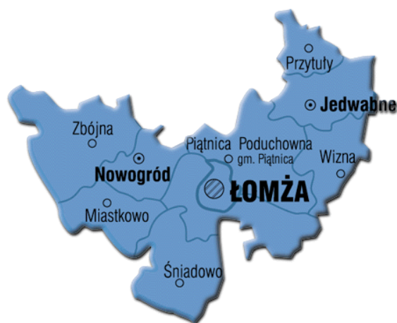
Rysunek 1. Położenie Wizny w powiecie łomżyńskim i gminie Wizna

Wizna jest dużą wsią gminną położoną w zachodniej części województwa podlaskiego, w powiecie łomżyńskim. Od miasta powiatowego – Łomży, dzieli ją ok. 20 km, od stolicy województwa – Białegostoku, ok. 60 km. Położona jest w sąsiedztwie drogi krajowej nr 64 łączącej drogę krajową nr 8 Warszawa – Białystok z drogą krajową nr 61 Łomża – Augustów; przebiegają przez nią drogi powiatowe: nr 1934B Piątница Poduchowna – Drozdowo – Bronowo – Wizna oraz nr 1961B Wizna – Męczi – Jedwabne.