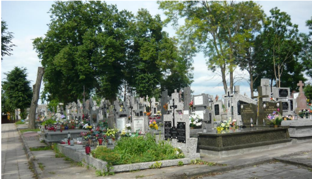
Zdjęcie 4. Cmentarz rzymskokatolicki w Wiźnie