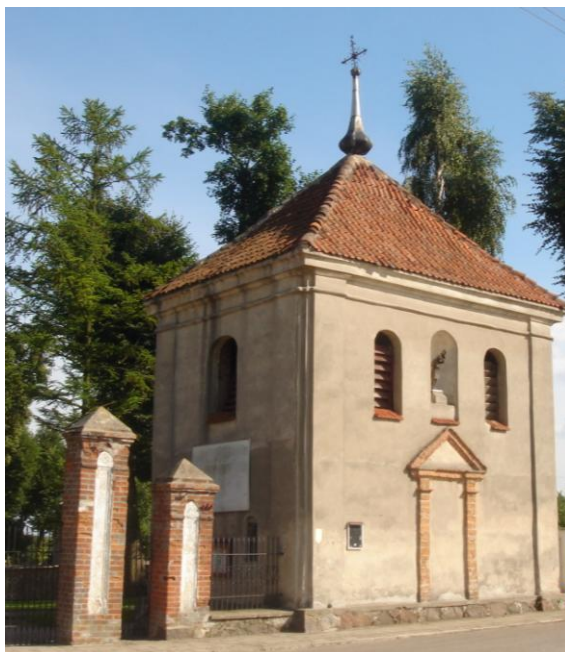
Zdjęcie 3. Barokowa dzwonnica