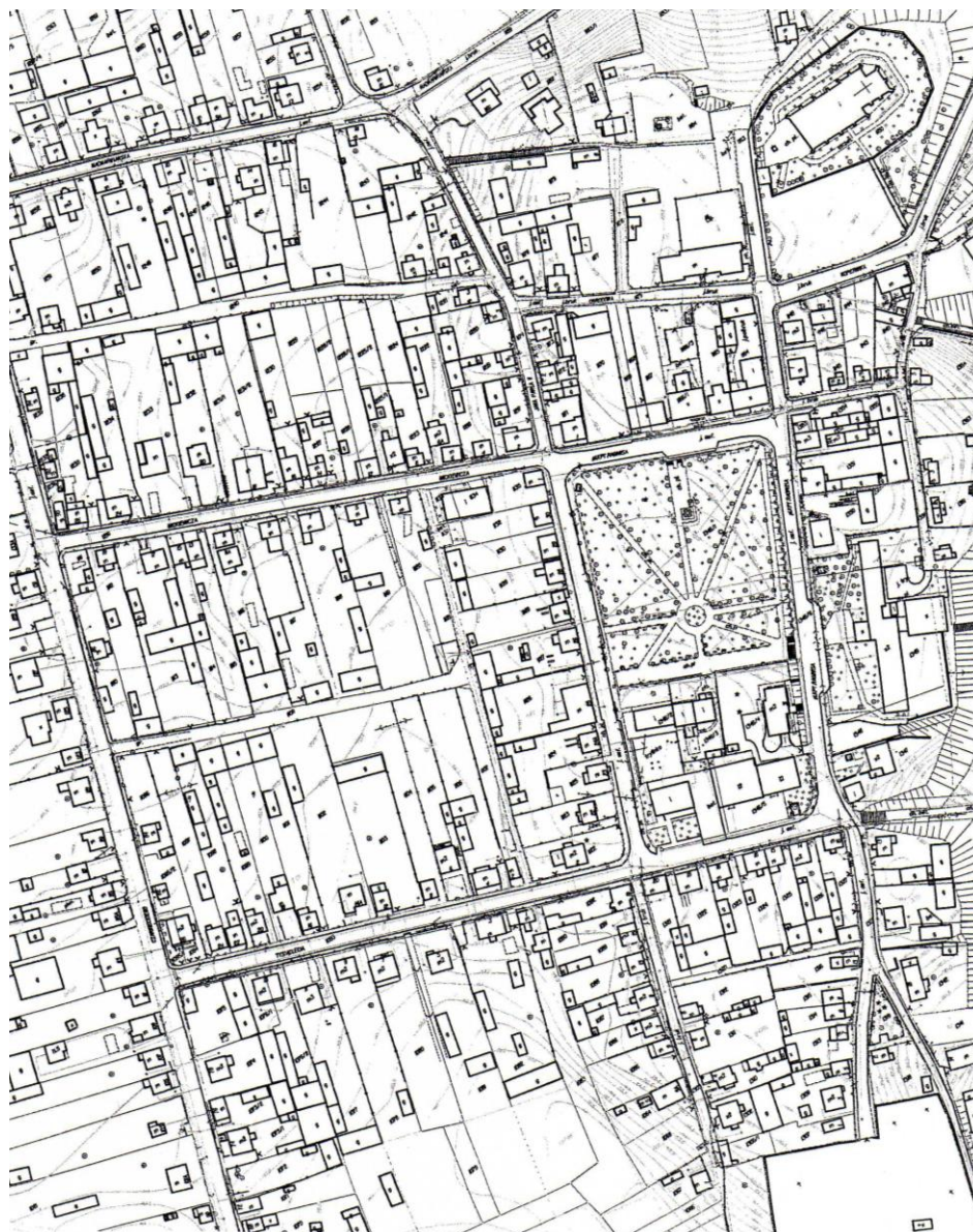
Rysunek 3. Centrum miejscowości Wizna

W Wiznie obszarem o szczególnym znaczeniu dla zaspokojenia potrzeb mieszkańców oraz sprzyjającym nawiązywaniu kontaktów społecznych jest centrum miejscowości, czyli rynek z zachowanym średniowiecznym układem przestrzennym wychodzących z niego ulic: Cmentarnej, Zamkowej, 1000-lecia, Mickiewicza, Jana Pawła II, Pawła z Wizny i Senatorskiej.