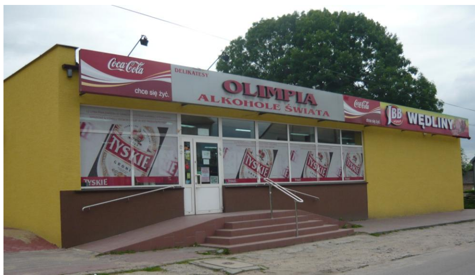
Zdjęcie 16. Sklep Olimpia przy ul. Mickiewicza w Wiźnie

Przy ulicy Mickiewicza zlokalizowane są 3 sklepy, w tym największy w Wiźnie sklep Olimpia (jedyny samoobsługowy).