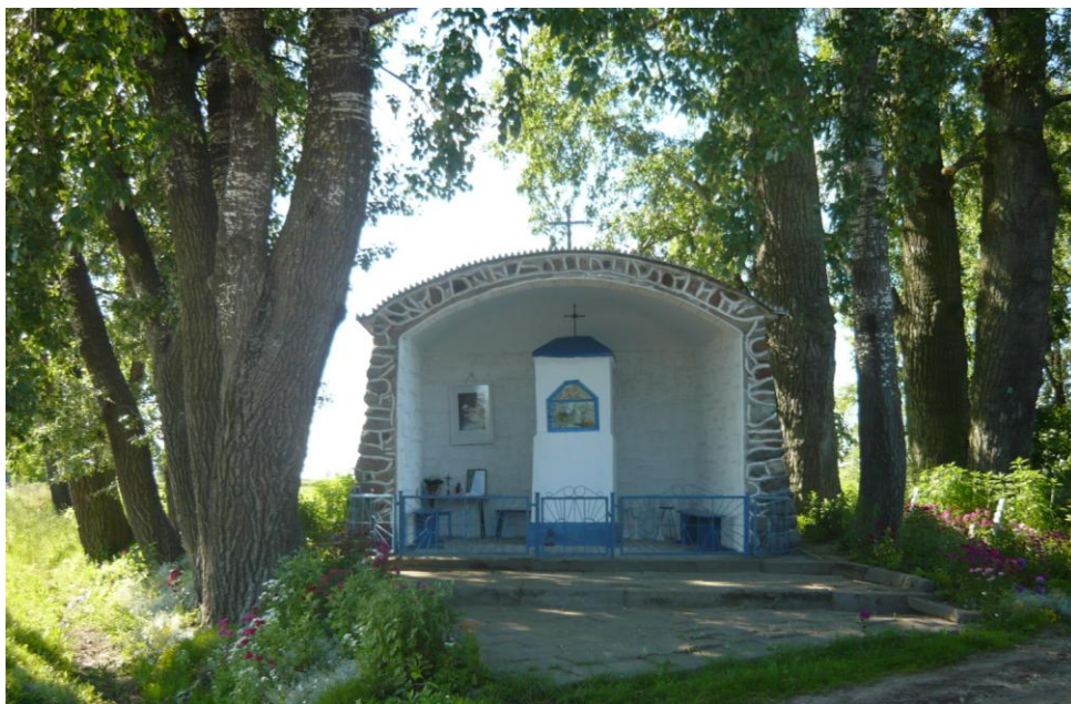
Zdjęcie 8. Kapliczka przy drodze z Wizny do Srebrowa

Warto również zobaczyć znajdującą się przy drodze z Wizny do Srebrowa kapliczkę, na jej szybie w 1996 roku pojawił się wizerunek Matki Boskiej z Dzieciątkiem, który przyjeżdżali oglądać ludzie z całego kraju. Kapliczka stoi pomiędzy drzewami – pomnikami przyrody, w zbudowanej w 1996 roku grocie z polnych kamieni. Zgodnie z legendą w miejscu tym stała kiedyś szubienica, na której tracono przestępców napadających na flisaków i okradających ich z towaru.