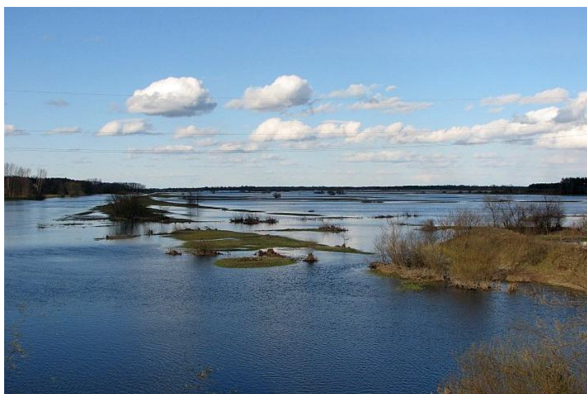
Zdjęcie 10. Rozlewiska Narwi w okolicy Wizny

Stosunkowo bogata rzeźba terenu uwarunkowana jest różnicami wzniesień, wysokości względne pomiędzy poszczególnymi formami morfologicznymi dochodzą do kilkudziesięciu metrów. Duże jest również zróżnicowanie nachylenia terenu – od prawie płaskich form dolinowych do ponad 15%. Dzięki tak ukształtowanej rzeźbie terenu istnieją liczne naturalne punkty widokowe, z których można podziwiać panoramę okolicy. Atrakcyjność krajobrazową wzbogacają wody powierzchniowe, głównie rzeka Narew, która w tej części doliny silnie meandruje. Wahania stanów wód w stacji wodowskazowej w Wiźnie zawierają się pomiędzy 200 a 479 cm, przy średnim rocznym stanie wynoszącym 349 cm. Nieuregulowane koryto rzeczne sprawia, że co roku w okresie wiosennych roztopów rzeka wylewa na rozległe tereny terasy zalewowej.