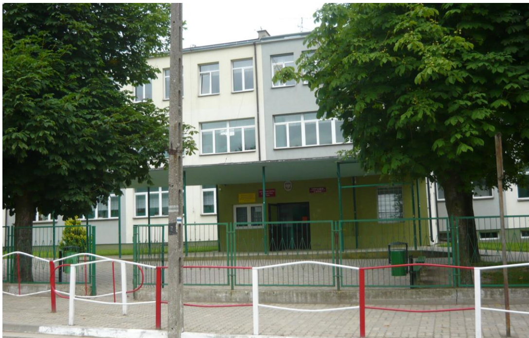
Zdjęcie 15. Budynek Szkoły Podstawowej i Gimnazjum w Wiźnie

Przy samym rynku (placu kpt. Raginisa) i niektórych ulicach wychodzących z jego narożników znajdują się ważne dla miejscowej społeczności obiekty. Przy placu kpt. Raginisa mieści się Urząd Gminy, ośrodek zdrowia, apteka, poczta, bank, szkoła podstawowa, gimnazjum oraz większość znajdujących się w miejscowości sklepów, a także plac, na którym w każdy poniedziałek odbywa się targ.