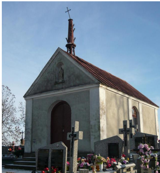
Zdjęcie 5. Kaplica cmentarna