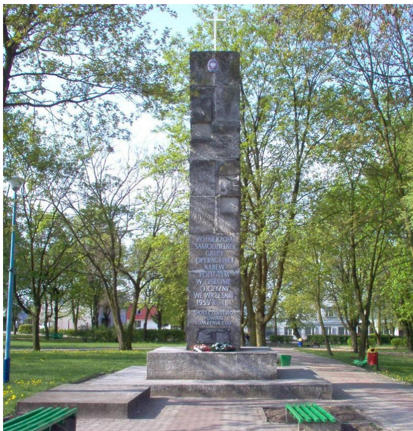
Zdjęcie 9. Pomnik Obrońców Odcinka Wizna Samodzielnej Grupy Operacyjnej Narew znajdujący się w parku w Wiźnie

W szkole istnieje Izba Pamięci, w której zgromadzone są pamiątki z okresu II wojny światowej, głównie dotyczące bitwy pod Wizną. Jednak pomieszczenie, w którym się mieści jest nieodpowiednie, aby można było właściwie wyeksponować zgromadzone eksponaty.