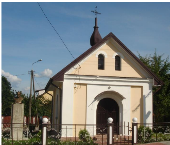
Zdjęcie 6. Kapliczka przy ul. Czarnieckiego