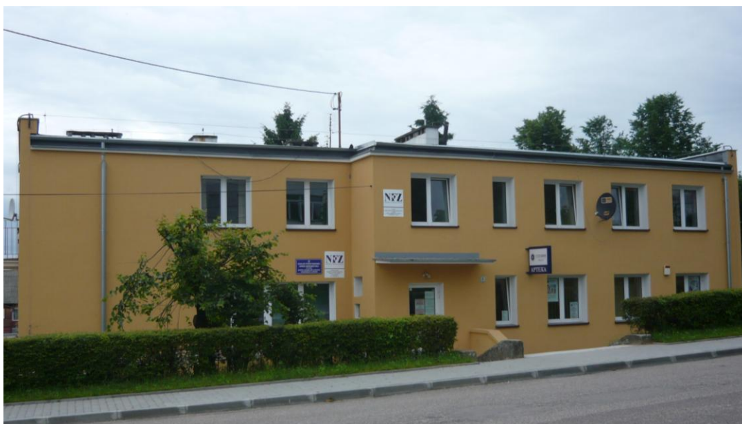
Zdjęcie 13. Gminny Ośrodek Zdrowia

Podstawową opiekę zdrowotną zapewnia mieszkańcom Gminny Ośrodek Zdrowia. Ośrodek jest jednostką organizacyjną Zakładu Podstawowej Opieki Zdrowotnej w Łomży, którego organem założycielskim i nadzorującym jest Rada Powiatu Łomżyńskiego. W skład GOZu wchodzi: gabinety lekarza rodzinnego, gabinet rehabilitacji oraz poradnia ginekologiczno-położnicza. W budynku ośrodka mieści się również apteka.