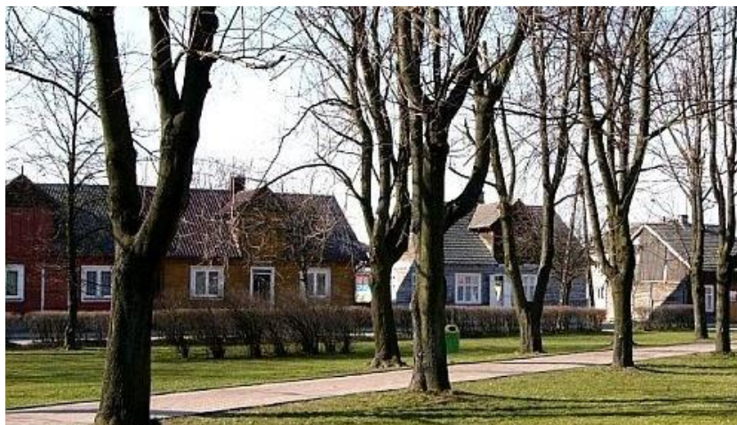
Zdjęcie 1. Drewniane domy z charakterystycznymi lukarnami w kalenicowej zabudowie wokół rynku

W Wiźnie dominuje zabudowa zagrodowa. Wokół rynku zachowała się częściowo luźna, kalenicowa, parterowa, drewniana i murowana zabudowa pochodząca z XIX i XX wieku.