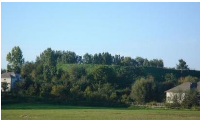
Zdjęcie 7. Widok na Górę Zamkową od strony rzeki Narew

Ponadto warte obejrzenia są domy mieszkalne drewniane i murowane z końca XIX i początku XX wieku.