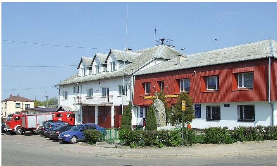
Zdjęcie 14. Budynek wielofunkcyjny, w którym mieści się remiza OSP, Urząd Gminy, GCI i biblioteka