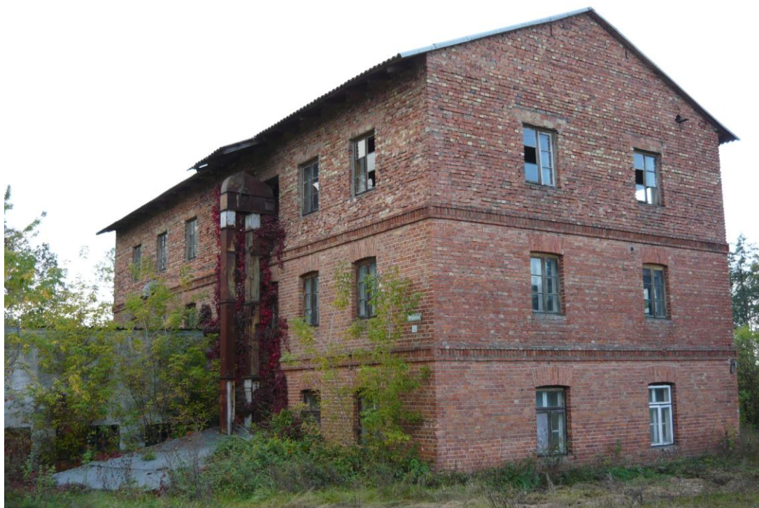
Zdjęcie 1. Młyn w Bronowie

Do dziś zachował się układ przestrzenny wsi zwany dwuulicówką. We wsi znajdują się zabytkowe domy oraz młyn wodny z lat dwudziestych XX wieku.