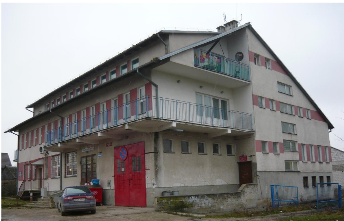
Zdjęcie 4. Budynek wielofunkcyjny w Bronowie

W Bronowie działa Ochotnicza Straż Pożarna, skupiająca obecnie 26 członków, w tym 14 czynnych. Jednostka posiada we wsi bazę w postaci remizy w wielofunkcyjnym budynku, w którym mieści się również filia Gminnej Biblioteki Publicznej, sklep spożywczo-przemysłowy i świetlica wiejska wykorzystywana do celów sportowych oraz zebrań mieszkańców wsi. Stan techniczny budynku wielofunkcyjnego jest średni.