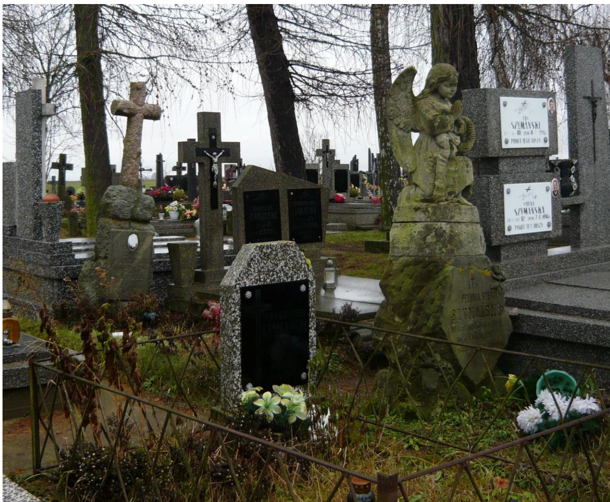
Zdjęcie 3. Zabytkowe nagrobki na cmentarzu w Bronowie