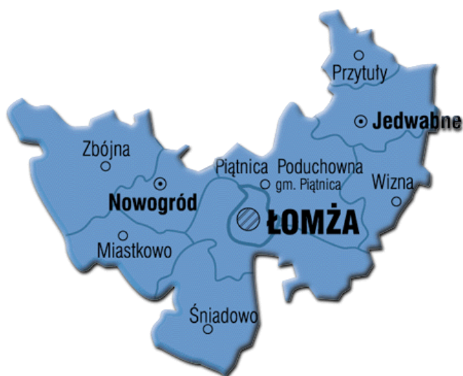
Rysunek 1. Położenie gminy Wizna w powiecie łomżyńskim

Bronowo jest wsią położoną w zachodniej części województwa podlaskiego, w powiecie łomżyńskim, w gminie Wizna. Od miejscowości gminnej – Wizny, dzieli je ok. 5 km, od miasta powiatowego – Łomży, ok. 20 km, od stolicy województwa – Białegostoku, ok. 65 km. Przez Bronowo przebiega droga powiatowa nr 1934B Piątnica Poduchowna – Drozdowo – Bronowo – Wizna oraz droga gminna nr 105625B Wizna – Bronowo.