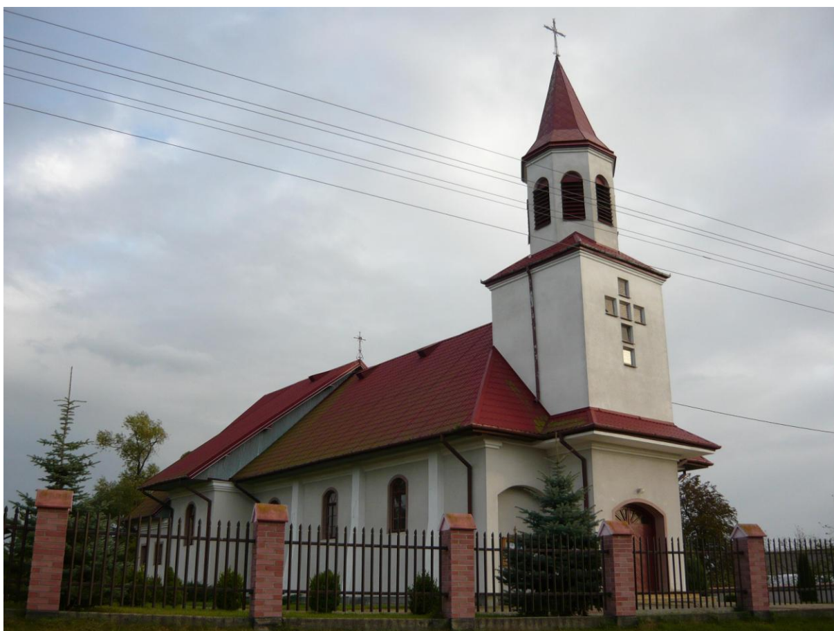
Zdjęcie 2. Kościół parafialny w Bronowie