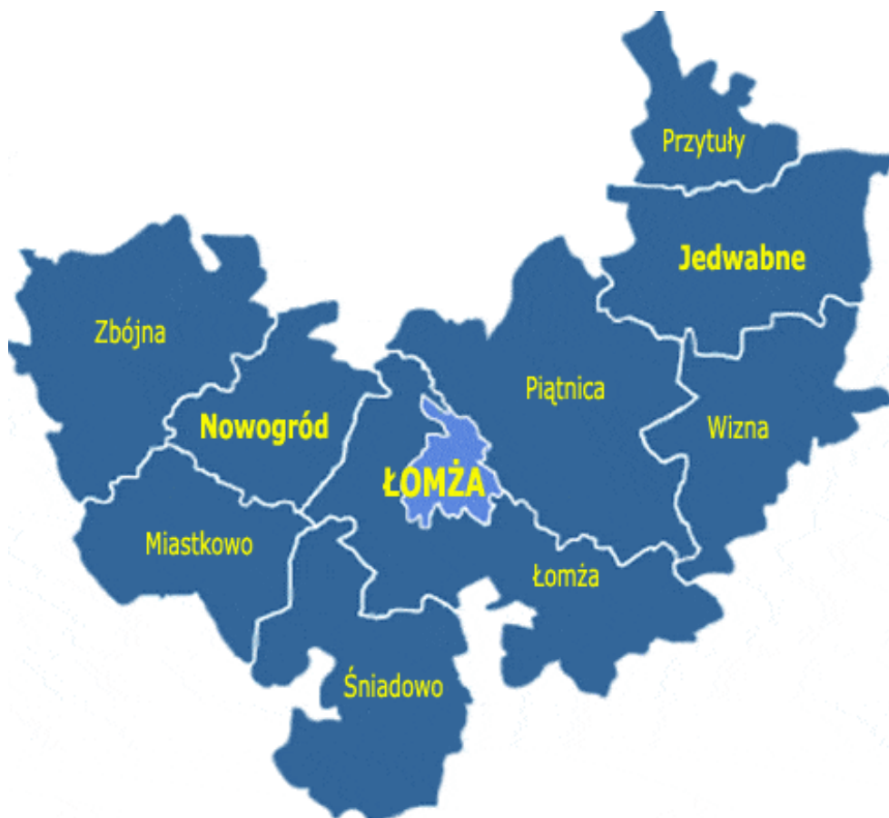
Rys. 1. Gmina Wizna w powiecie łomżyńskim.

Gmina Wizna leży w zachodniej części województwa podlaskiego. Należy do powiatu łomżyńskiego i jest zlokalizowana w jego wschodniej części (rys.1). Od strony północnej gmina Wizna graniczy z gminą Jedwabne, od zachodniej z gminą Piątnica, od Południa z gminami Rutki (powiat zambrowski) i Łomża, a od Wschodu z gminami Zawady (powiat Białostocki) i Trzcianne (powiat moniecki). Teren gminy podzielony jest na 24 sołectwa: Boguszki, Bronowo, Janczewo, Jarnuty, Kokoszki, Kramkowo, Małachowo, Męczki, Mrówki, Niwkowo, Nowe Bożejewo, Nieławice, Rutki, Rutkowskie, Ruś, Sambory, Sieburczyn, Srebrowo, Stare Bożejewo, Wierciszewo, Wizna I, Wizna II, Włochówka i Zanklewo. Gmina Wizna jest szóstą w powiecie łomżyńskim pod względem zajmowanej powierzchni (9,8% powierzchni powiatu łomżyńskiego) i liczy około 13 305 ha (133 km 2 ).