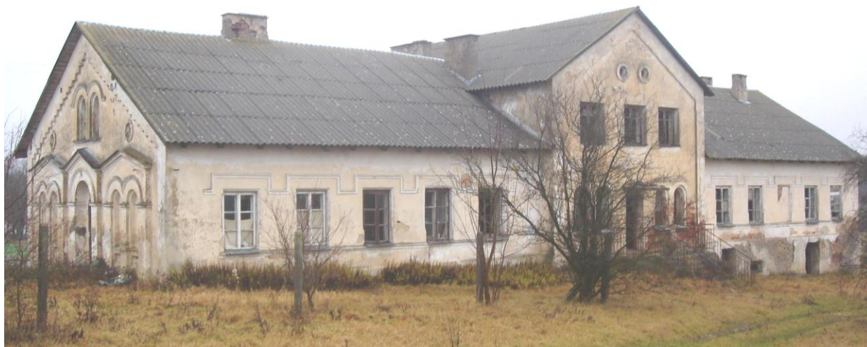
Zdjęcie 1. Dwór w Janczewie

posadowione na wspólnym gzymsie podokiennym i zwieńczone ciągłym gzymsem odcinkowym z uskokami między otworami. Układ wewnątrz jest dwutraktowy, korytarzowy, z szeregiem stosunkowo małych pomieszczeń. Konsekwencja stylistyczna z jaką opracowano wszystkie elewacje ma charakter neoromański z akcentami neogotyckimi.