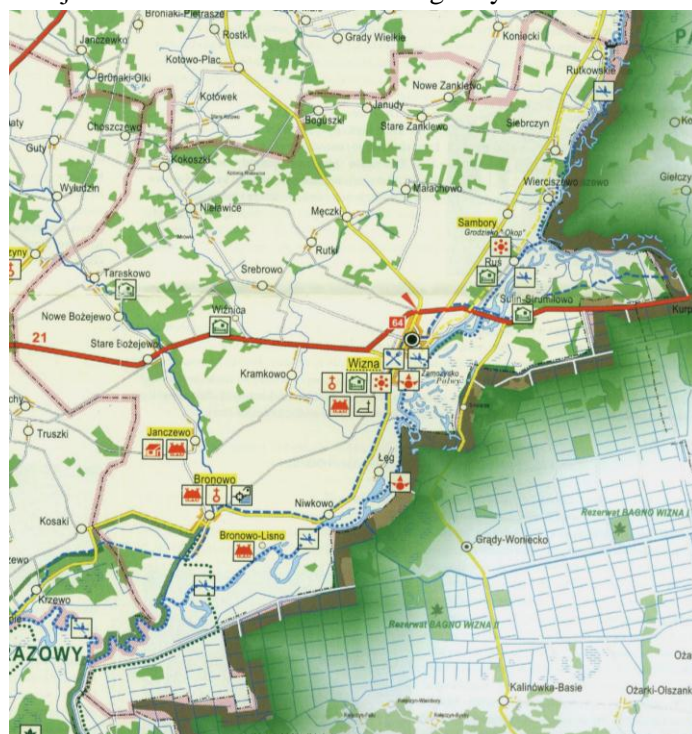
Rysunek 1. Położenie miejscowości Janczewo na terenie gminy Wizna

Janczewo jest wsią położoną w zachodniej części województwa podlaskiego, w powiecie łomżyńskim, w gminie Wizna. Od miejscowości gminnej – Wizny – dzieli je ok. 8 km, od miasta powiatowego – Łomży – ok. 15 km, od stolicy województwa – Białegostoku – ok. 70 km. Miejscowość położona jest przy drodze powiatowej nr 1964B Bronowo – Janczewo – Stare Bożejewo – Taraskowo – Olszyny, ok. 2 km od drogi krajowej nr 64.