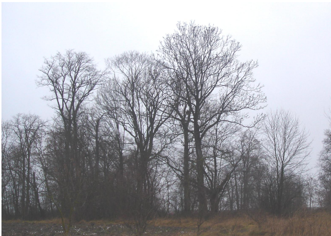
Zdjęcie 3. Pozostałości parku dworskiego z drzewami – pomnikami przyrody