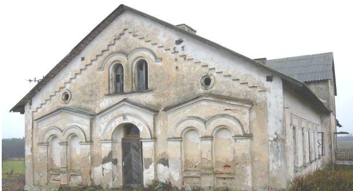
Zdjęcie 2. Widok dworu w Janczewie od strony szczytu wschodniego

Bardzo bogato zdobiona jest elewacja szczytu wschodniego (rys. 2). Tworzą ją trzy edikule, z których każda jest zwieńczona trójkątnym naczółkiem. Środkowa pełni funkcję portalu, boczne zawierają w sobie podwójne, arkadowe blendy. W szczycie znajdują się podwójne