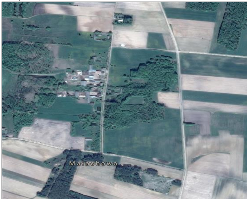
Rysunek 3. Miejscowość Małachowo

w granicach pagórków kemowych wodnolodowcowe piaski i żwiry. W strefie moren czołowych występują piaski i żwiry, piaski i pospółki gliniaste oraz gliny o zróżnicowanej miąższości związanej z wysokością poszczególnych form morfologicznych. Na terenie miejscowości Małachowo znajduje się nieczynne wyrobisko, w którym zaprzestano eksploatacji surowców.