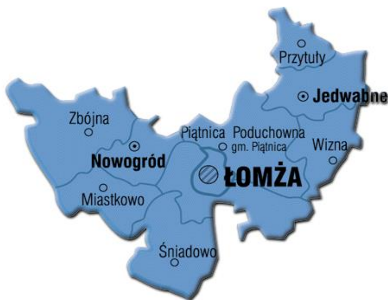
Rysunek 1. Położenie gminy Wizna w powiecie łomżyńskim.