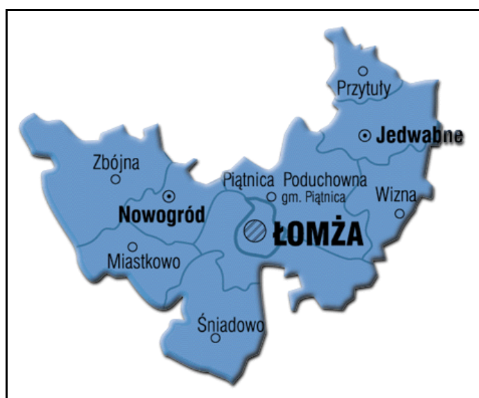
Rysunek 1. Położenie Wizny w powiecie łomżyńskim