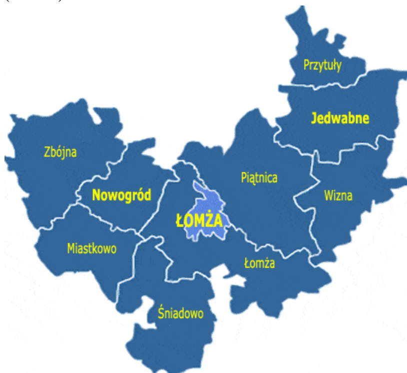
Rys. 1. Gmina Wizna w powiecie łomżyńskim.

Gmina Wizna położona jest w zachodniej części województwa podlaskiego. Należy do powiatu łomżyńskiego i jest zlokalizowana w jego wschodniej części (rys.1). Od strony północnej gmina Wizna graniczy z gminą Jedwabne, od zachodniej z gminą Piątnica, od Południa z gminami Rutki (powiat zambrowski) i Łomża, a od Wschodu z gminami Zawady (powiat Białostocki) i Trzcianne (powiat moniecki). Teren gminy podzielony jest na 24 sołectwa. Gmina Wizna jest szóstą w powiecie łomżyńskim pod względem zajmowanej powierzchni (9,8% powierzchni powiatu łomżyńskiego) i liczy około 13 305 ha (133 km 2 ).